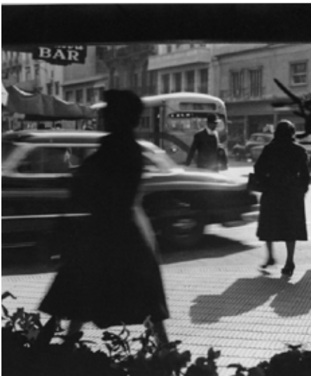
[2] Grete Stern, foto de Córdoba y Esmeralda, CABA, 1951. Disponible en www.ringlandpit.com . Foto ©Grete Stern.

Walter Loos, venido de Austria y que fuera alumno de Joseph Hoffman, diseña muebles y abre su propio local, Atelier, mientras que su mujer, Fridl Loos, abre el suyo –que llevó su nombre– de diseño de moda femenina.