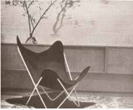
[9] Sillón BKF, diseño de los arquitectos Bonet, Kurchan y Ferrari Hardoy, 1938. Fuente: libro CIAM, A Decade of New Architecture 1937-1947, (1951), Zurich: editor S. Giedion.